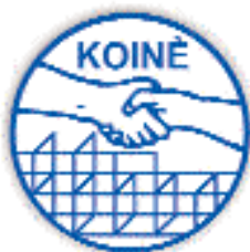
COOPERATIVA KOINÈ Almè