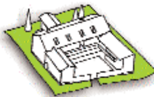
CONSORZIO LA CASCINA Villa d'Almè