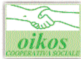
COOPERATIVA OIKOS Villa d'Almè

Venticinque anni fa un gruppetto di “visionari”, spronati da Gianfranco Sabbadin, faceva nascere nel territorio di Almè e di Villa d'Almè una cooperativa: avevano l'idea, abbastanza strana per quei tempi (e non solo allora) che le persone disabili potessero lavorare in luoghi di lavoro normali e che potessero vivere esperienze di vita come tutti, insieme a tutti gli altri. Era la grande scommessa dell'integrazione sociale, da cui è nata la cooperativa Lavorare Insieme, e poi la cooperativa Koinè, la Cascina a Villa d'Almè, la Oikos. Molti allora hanno guardato con sospetto o con sufficienza quel gruppetto di illusi: come si fa a pensare che possa stare in piedi un'azienda composta soprattutto da disabili? È possibile fare servizi di qualità per i disabili, senza basarsi sul sostegno assistenzialistico dello Stato?