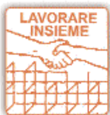
COOPERATIVA LAVORARE INSIEME Almè